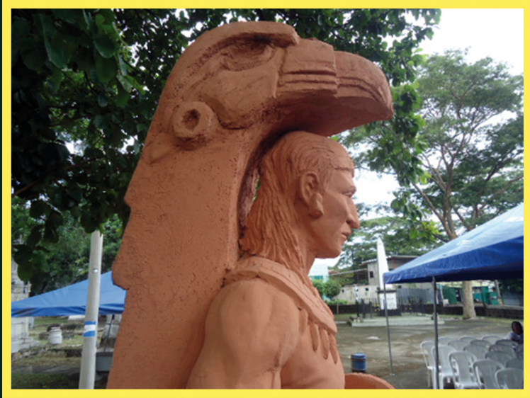
Monumento al Cacique Nicarao.