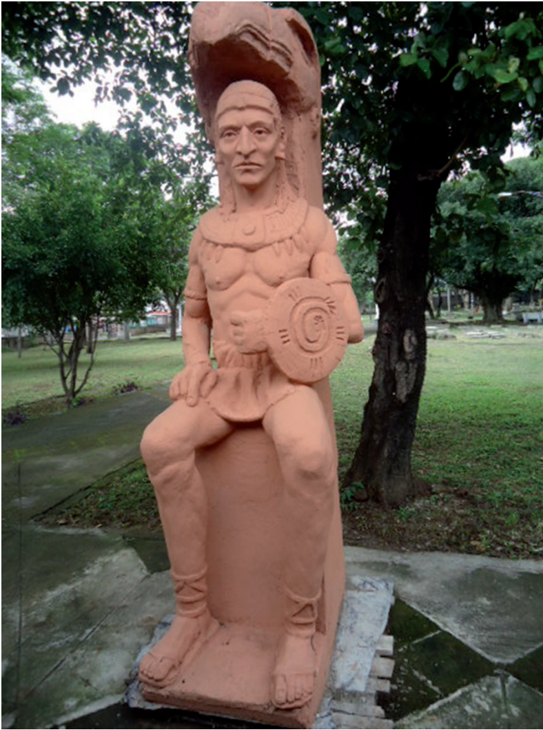
VISTA FRONTAL COMPLETA DEL MONUMENTO. ESCULTOR: SÓCRATES MARTÍNEZ. 12 de Octubre del año 2012. Managua, Nicaragua.